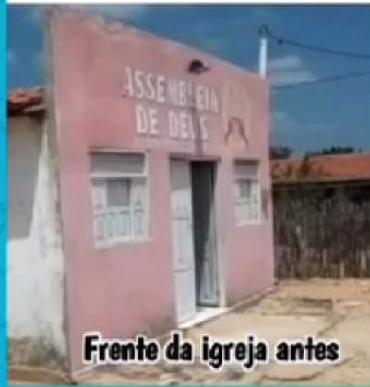
Frente da igreja antes