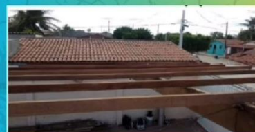
Concerto do telhado