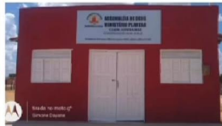
Frente da igreja Depois