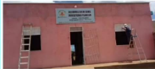
Frente durante a manutenção