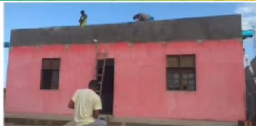
Frente da igreja antes