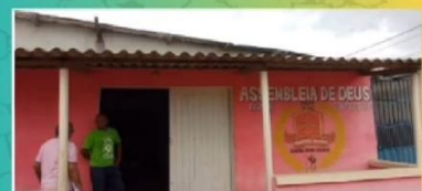
Congregação Jandaira 02