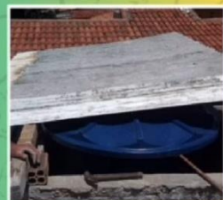
Trabalhos de manutenção das igrejas realizados pela área 06