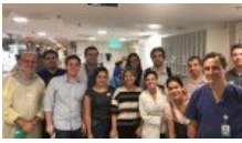
Médicos de congresso de Pneumologia atenderam vítimas do incêndio do Badim