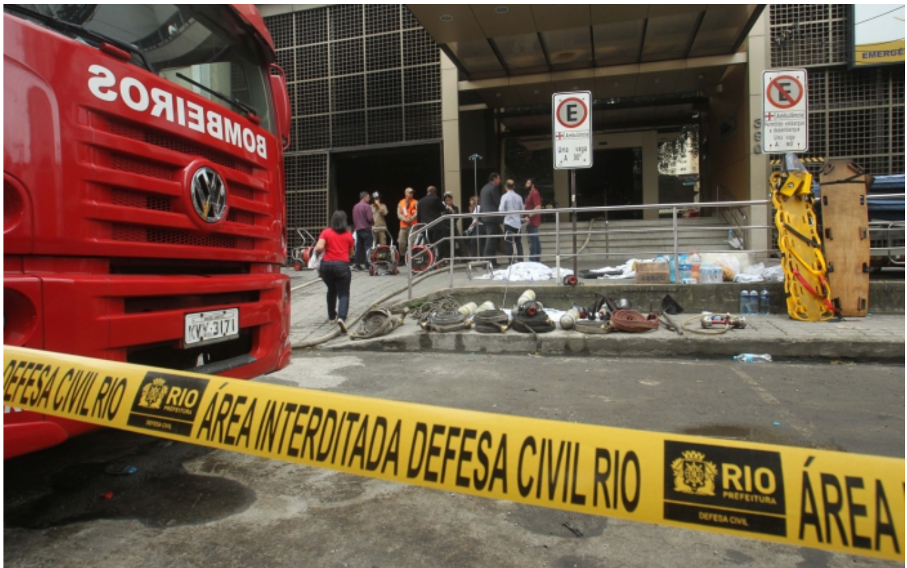
Incêndio destruiu parte do Hospital Badim, que foi interditado

Rio – Depois de 11 pacientes morrerem em decorrência de um incêndio no Hospital Dr. Badim, no Maracanã, Zona Norte do Rio, na última quinta-feira, a Polícia Civil investiga quais as causas do episódio. Nesta sexta-feira, dois eletricitistas da unidade foram ouvidos.