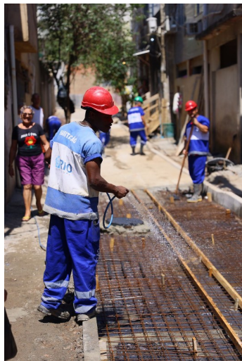
Obras do morar Carioca em andamento (Parque Nobre, Meringuava e Costa Barros)