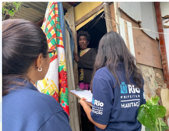
Trabalho técnico social no remanejamento de moradores em condições precárias no Pavão-Pavãozinho