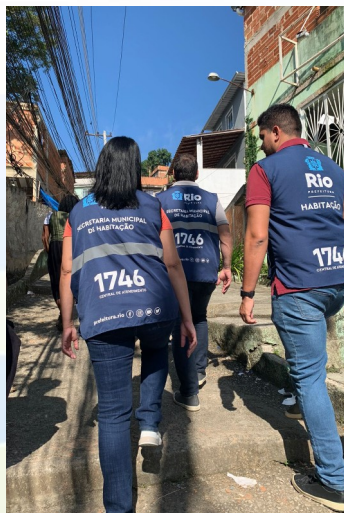
Trabalho técnico social e cadastramento para a Regularização Fundiária (Jacarepaguá, Tijuquinha, Parqua Alegria)