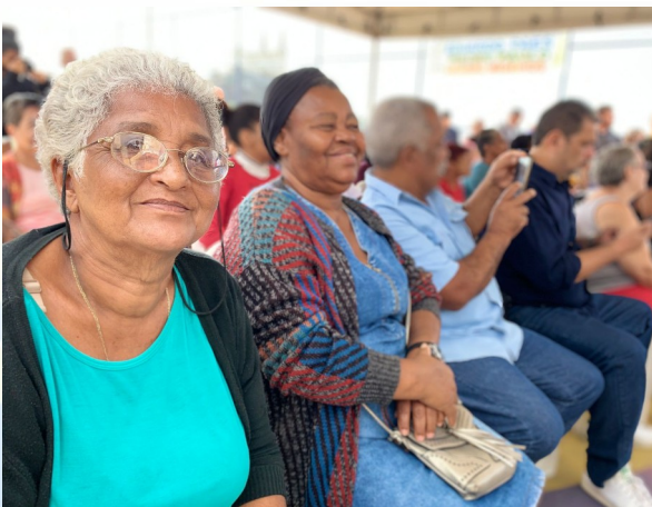
Anúncio e apresentação do projeto do Programa Morar Carioca no Complexo da Penha