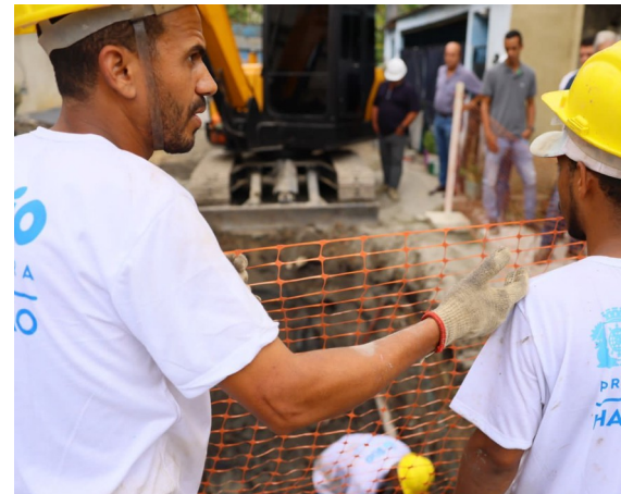
Obras do morar Carioca em andamento – Parque Nobre