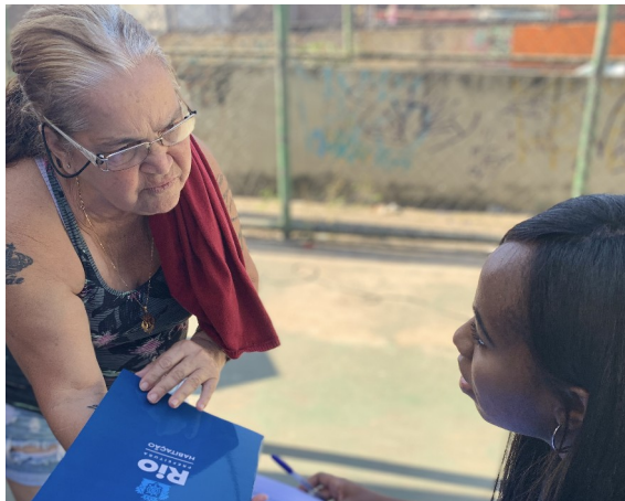
Entrega de TRM (Regularização Fundiária)– Parque Alegria