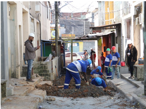
Obras do morar Carioca em andamento – Costa Barros