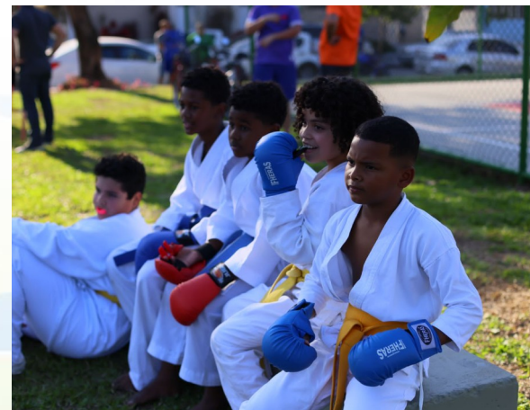
Inauguração de praça com atividades de projetos desportivos em Bangú