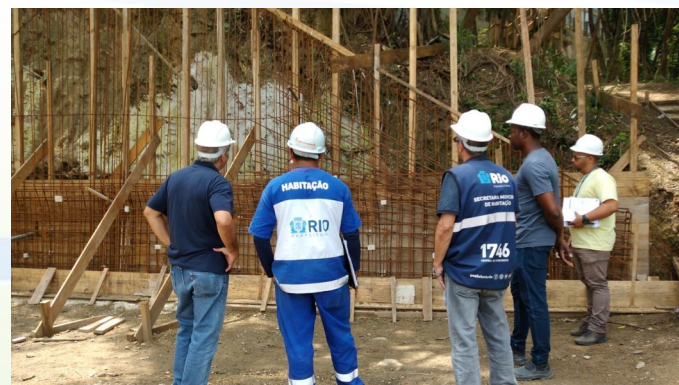
Obras em andamento - Produção habitacional no Chapéu Mangueira